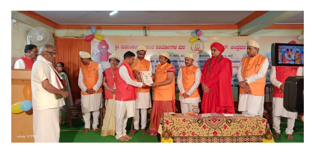
Yoga Youth Camp With Sri Patanjali Yoga Study & Research Center, Tumkur